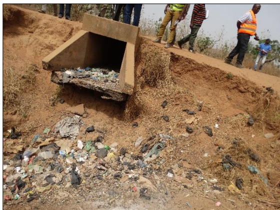
LOT n°4 : Région de la Kara _ dalot en ruine (situation initial)