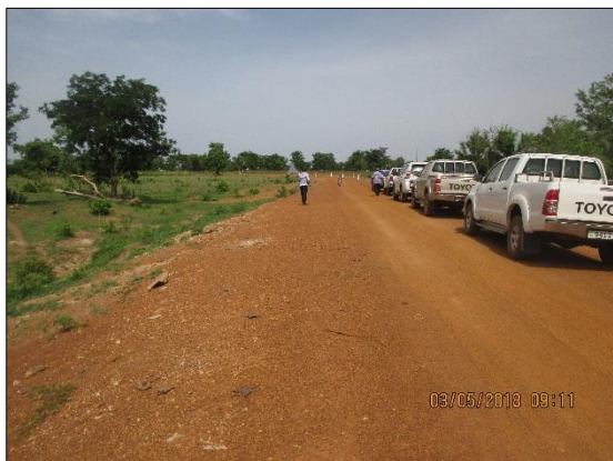
LOT n°4 : Région de la Kara _ piste en rase campagne (fin des travaux)