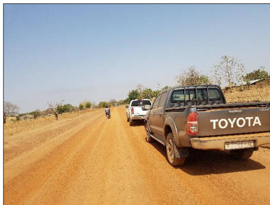
LOT n°4 : Région de la Kara _ piste en rase campagne (fin des travaux)