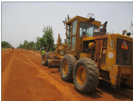
LOT n°4 : Région de la Kara _ travaux de rechargement (phase travaux)